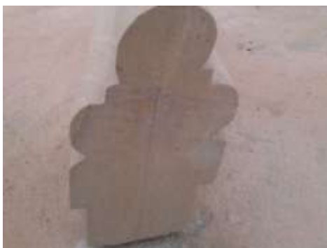
Fig.3 Claveau tierceron de biais.