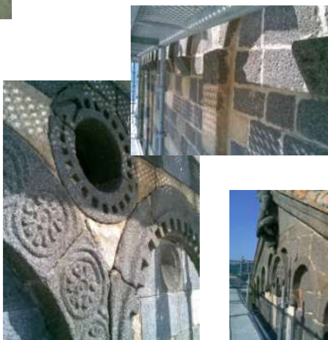
Fig.3-4-5 Photos avant intervention.