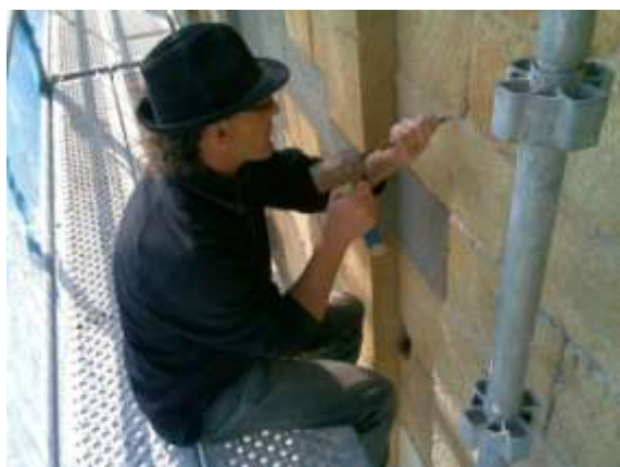
Fig.2 Intervention sur la face Sud de la chapelle. Travaux de décroutage du ciment mis dans des travaux antérieurs, qui avec le temps à causer des fissures dans la pierre. L'arrête de la pierre a aussi était retailée.