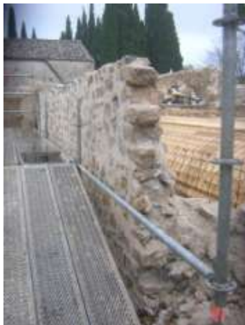
Fig. 1 Elévation d'un mur à l'ancienne recopié sur la partie EST du cloître (XIIème s.), vue de sa face.