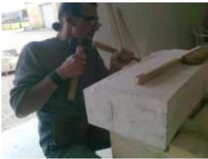
Fig.1 Action d'un épannelage sur un tierceron de biais.