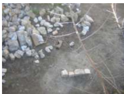
Fig. 3 Trie des pierres éboulées par ordre d'épaisseur et de hauteur