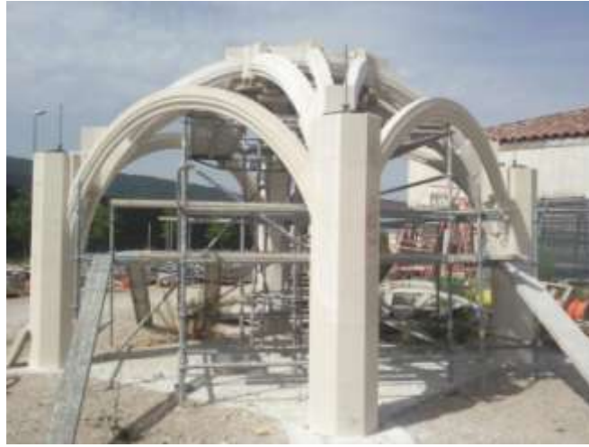
Fig.12 Fichage de la clef de voûte.