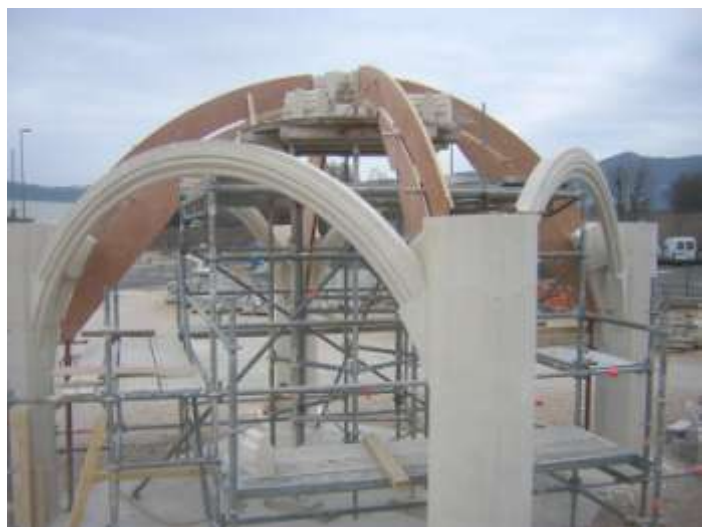
Fig.11 Pose et assise des diagonaux et tiercerions.