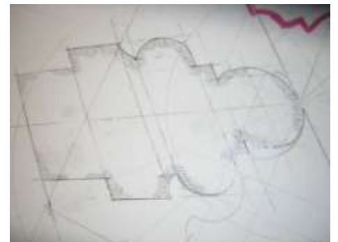
Fig.2 Epure d'un tierceron tiré d'un dessin au mur à l'échelle 1 (grandeur nature).