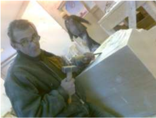
Fig.5-6-7 Taille d'un des chapiteaux qui reçoit le tierceron, le formeret et les diagonaux.