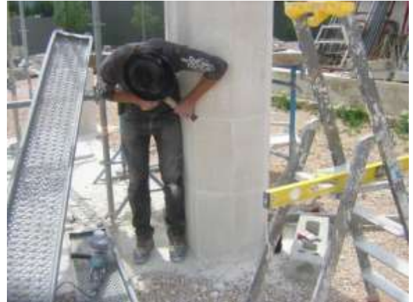
Fig.9 Ravalement des piliers