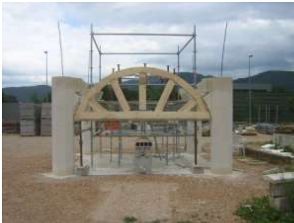
Fig.10 Pose de l'assise en bois pour recevoir l'intrados du formeret.