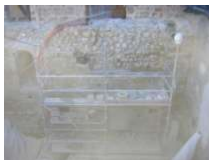
Fig. 4 Fichage des pierres. Résultat en attente de future restauration.