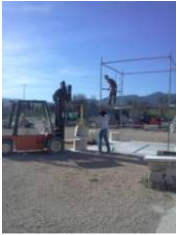
Fig.8 Pose des piliers.