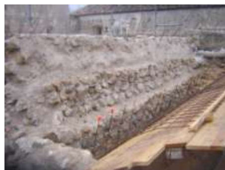
Fig. 2 Vue de la partie arrière de l'élévation en espalier qui recevra la voute du cloître.