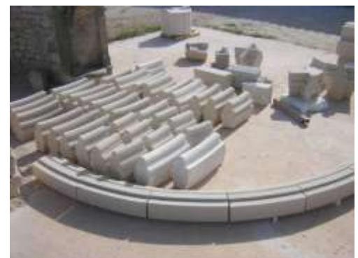
Fig.4 Résultat des ouvrages finis en attente de pose.